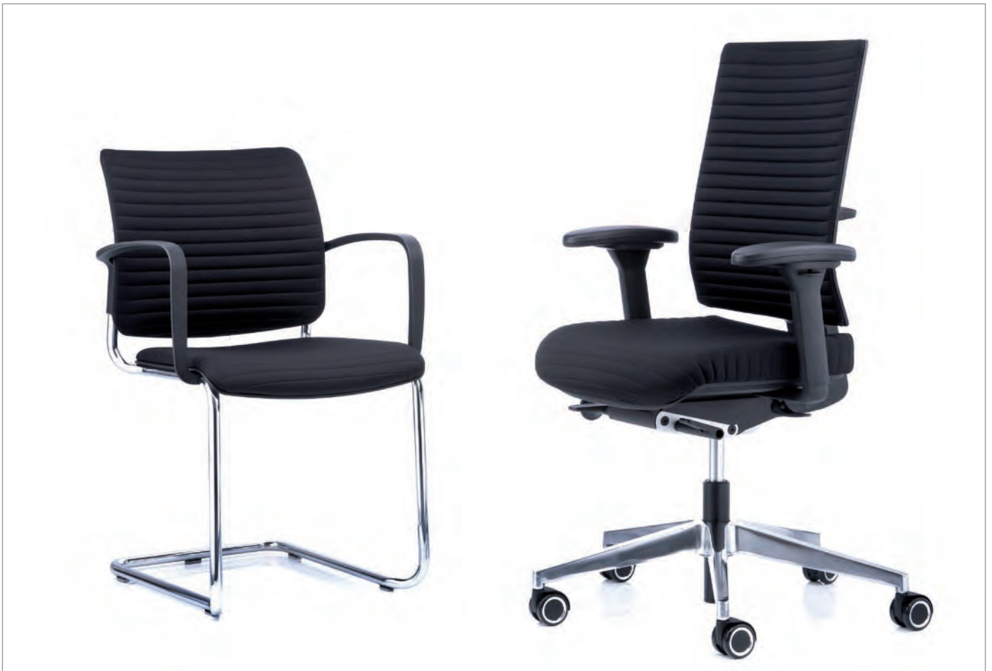
CONSITO® und ANTEO® TUBE