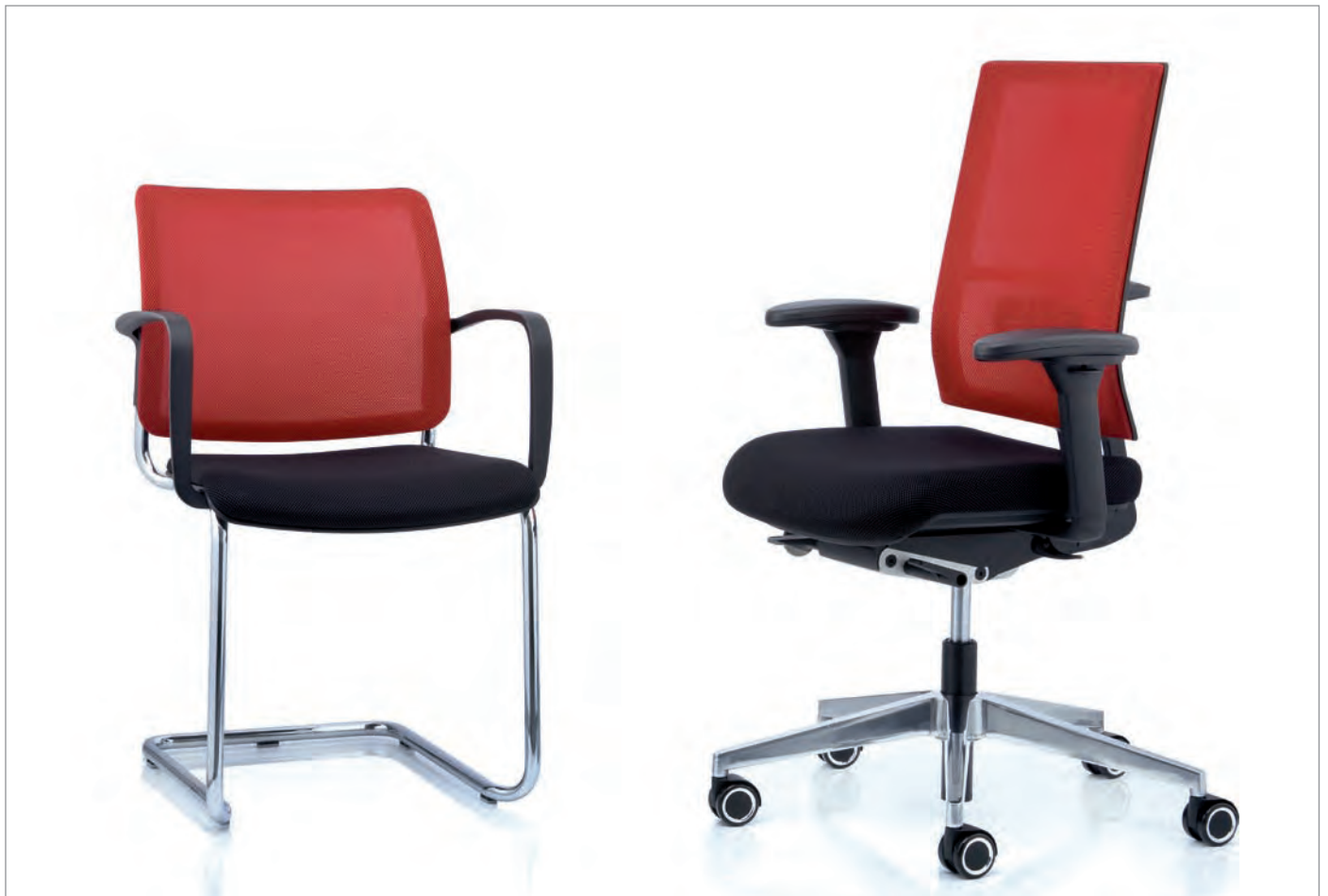
CONSITO® und ANTEO® NETWORK