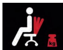
Anpressdruck der Rückenlehne

Optional: 7 cm Sitztiefeinstellung mit Verkürzung der Sitzfläche