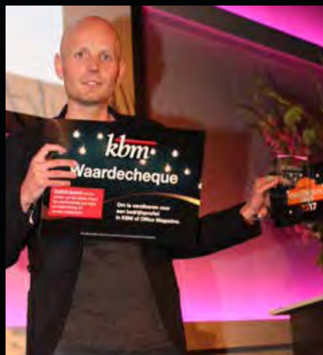
Categorie Online Discount Office