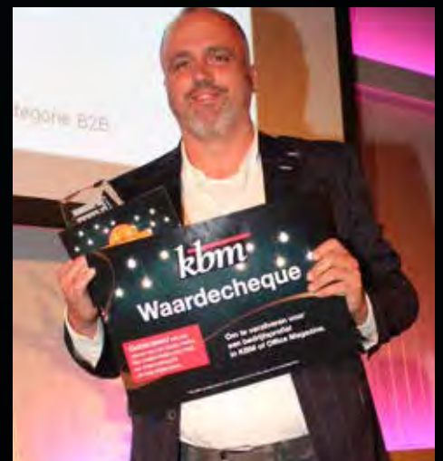
Categorie B2B Delo Haro den Tuinder