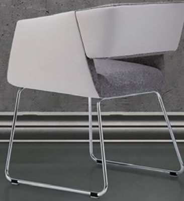
ARTISO-SERIE: Nur wer gut sitzt, kann auch entspannt kommunizieren.